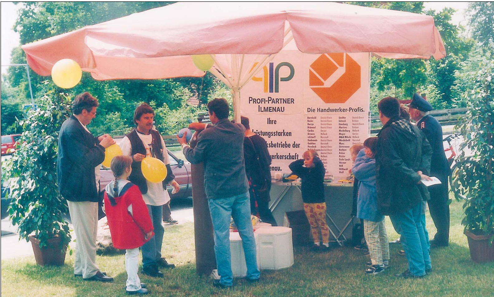
Bei vielen Messen und öffentlichen Anlässen engagieren sich die Profi-Partner Ilmenau mit einem Stand.